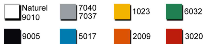
Gamme de couleur