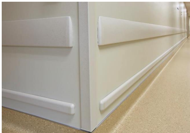
1500 Protection murale 500 Protection murale