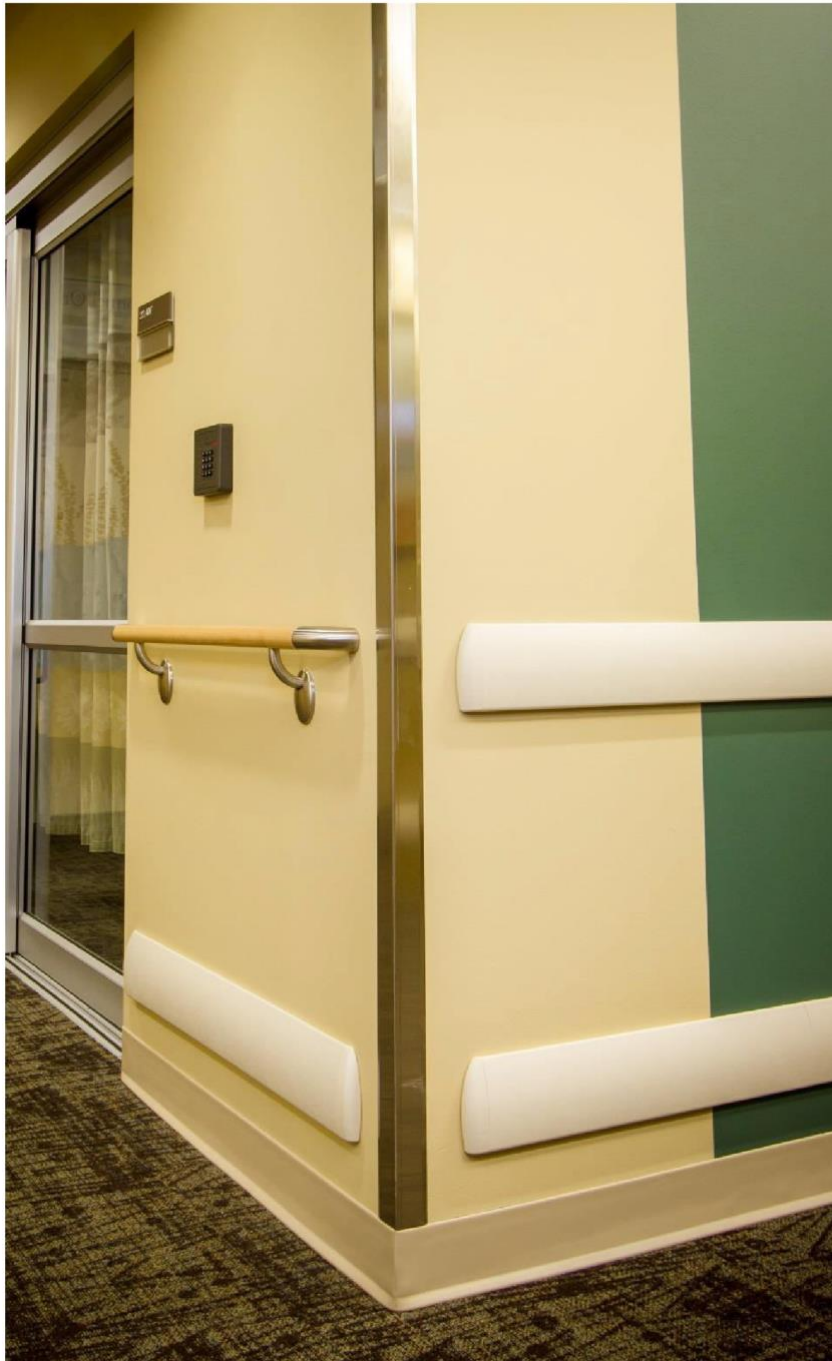
Les systèmes de protection murale sont conçus pour la protection et la décoration des murs.