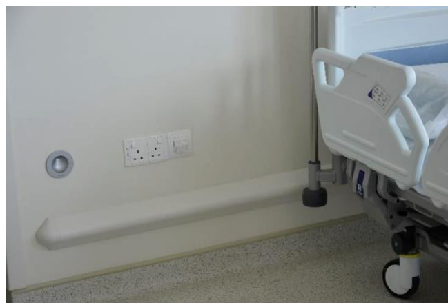
G2 1300 Protection murale