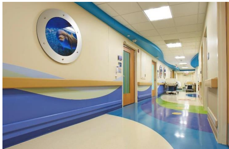
1400 Protection murale