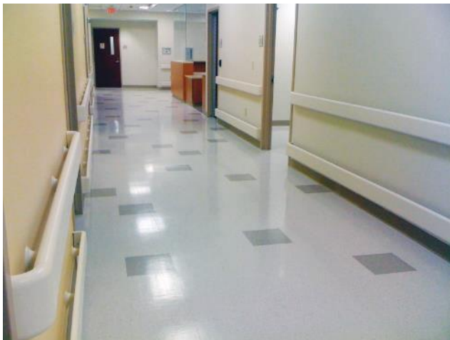
Mains courantes 800