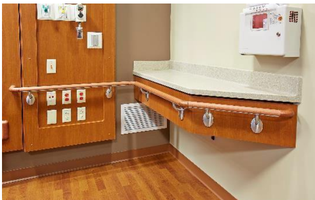
Mains courantes 900