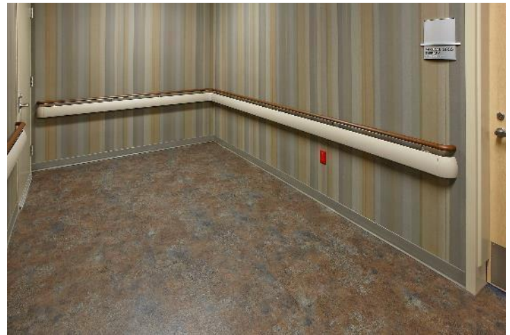
Mains courantes 3500