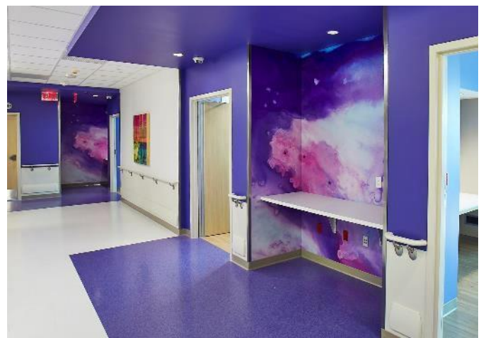
Mains courantes 2000